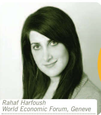
Rahaf Harfoush World Economic Forum, Geneva

Rahaf Harfoush – fra lederteamet i Obamas valgkampanje