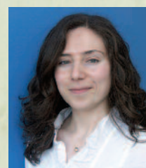
Wajda Irfaeya Göteborgs universitet