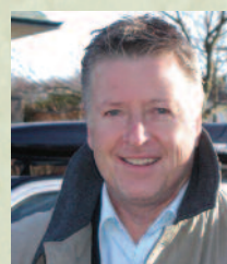
Lars Edgren Nordic Centre for Health and Social Assessment