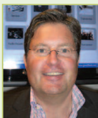
Stein Olsaker Profitek AS