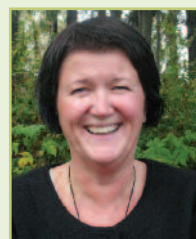
Randi Ajer Gymtimen AS