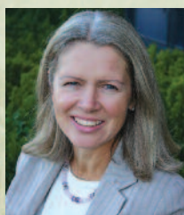
Lene Tennebeck Storebrand Livsforsikring AS