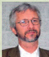
Kåre Hagen Handelshøyskolen BI