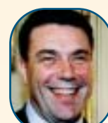
▶ Stein Erik Hagen