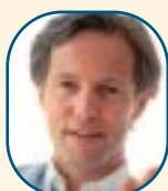
▶ Bjørn-Erik Willoch