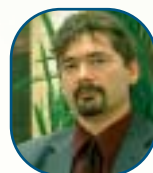
Jon S. von Tetzchner