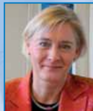
Unni Vennemoe, IAEA