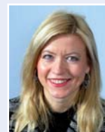
Gro Baade Mathiesen Aibel AS