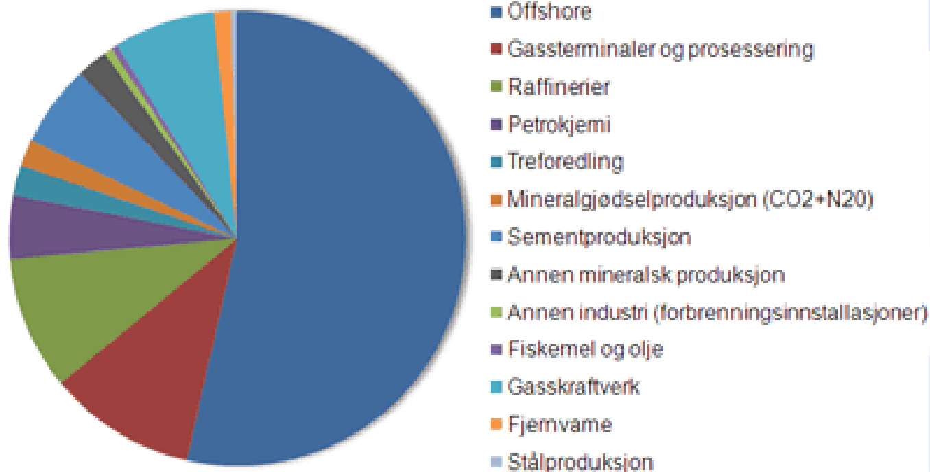
Sektorfordeling av kvotepliktige utslipp i 2010