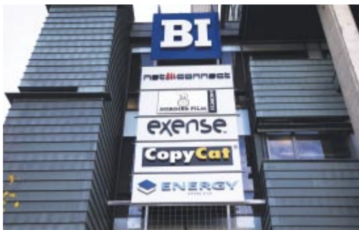
DELTID. Studentene ved BI jobber mer deltid og oftere får økonomisk støtte fra familie enn andre studenter.

En fersk undersøkelse fra Siviløkonomene slår fast at studentene ved BI jobber mer deltid og oftere får økonomisk støtte fra familie enn andre studenter. Ved Norges Handelshøyskole har 56 prosent deltidsjobb, mens hele 74 prosent av BI studentene jobber deltid.