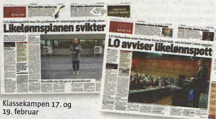
Klassekampen 17. og 19. februar